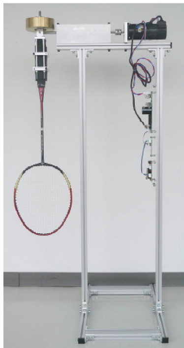
シャトル打ち出しロボBBM